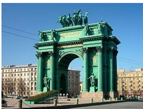
Нарвские триумфальные ворота

По материалам глобальной сети Интернет Материал собирали и обобщали учащиеся 8а и 8б классов