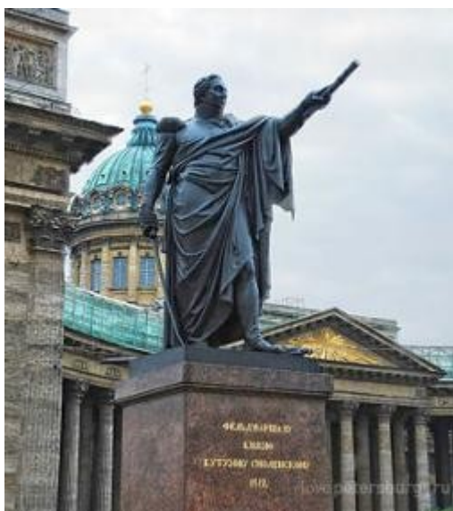
Памятник М. И. Кутузову у Казанского собора