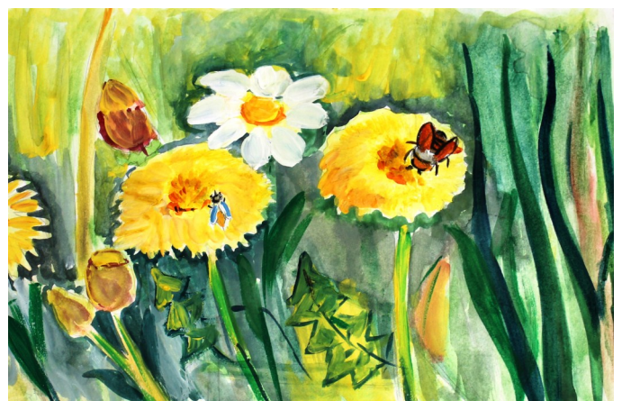
«Полевые цветы», рисунок Алины Никитиной, 8А класс

Сбор макулатуры. Этот материал является ресурсом для новых изделий. Для упаковки и тары, для изготовления изоляционных и кровельных материалов. Перерабатывая макулатуру, производитель уменьшает количество вырубленных лесов. Подсчитано, что переработка одной тонны макулатуры: - сохраняет 17 деревьев;- экономит 20 тыс. литров чистой воды и несколько тысяч киловатт электричества; - предотвращает выброс в атмосферу 1 700 кг. углекислого газа.