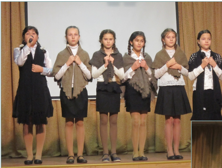
На фото: концерт для ветеранов-блокадников